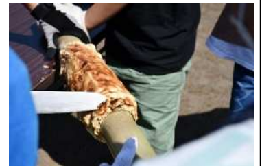
グループで協力して、1つの バウムクーヘンを作ります