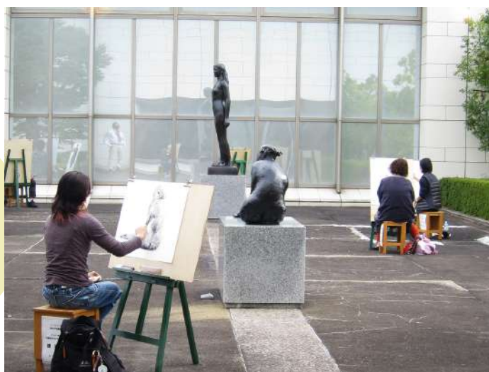
2022年度開催東海大学協働事業 デッサン教室「所蔵彫刻作品を描いてみよう！」のようす

東海大学の先生方から 道具の使い方や描き方 対象の観察の仕方など 木炭デッサンの基礎を 学ぶことができます！