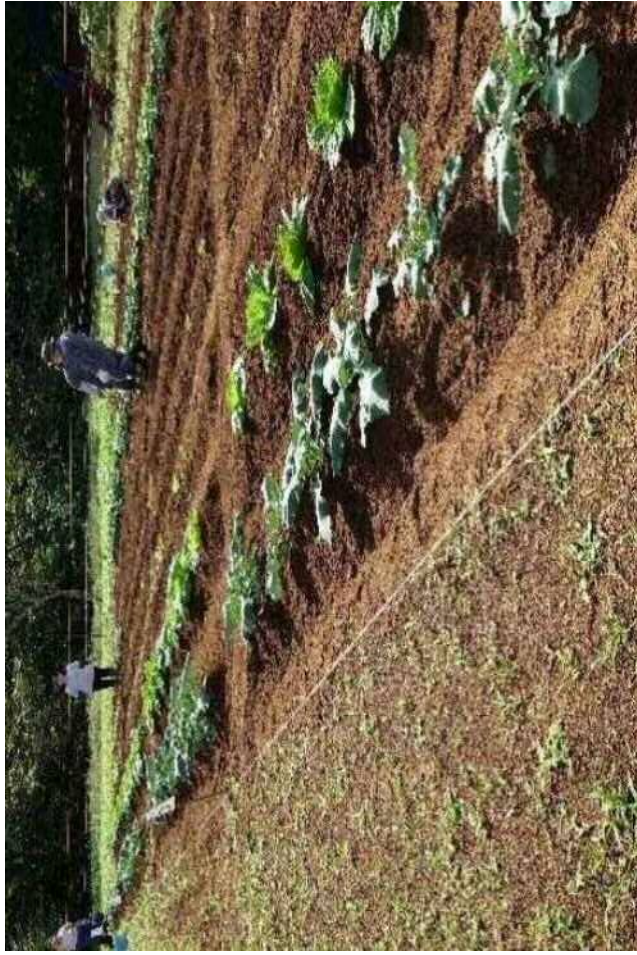
秋冬野菜種蒔き・定植（9/17）