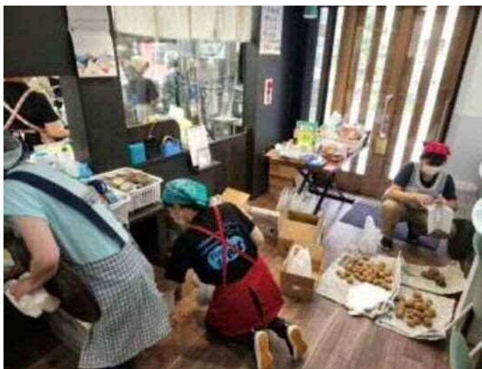
提供する食事の準備 (8月)