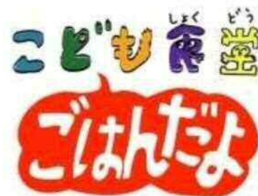
開催時に掲示する看板