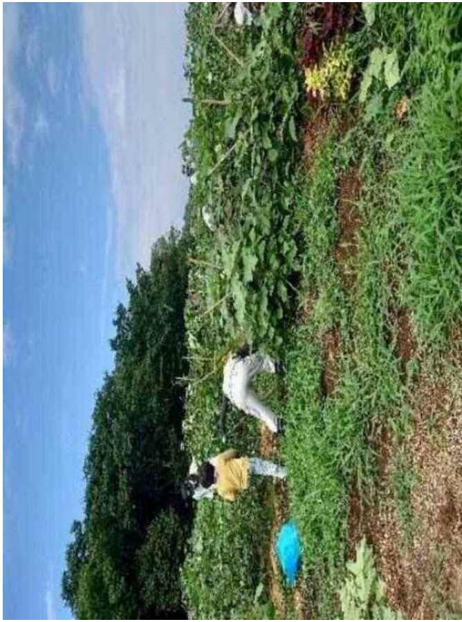
夏野菜収穫・除草（8/21）