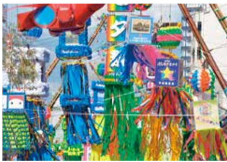
前回の市民プラザ側湘南スターモール入り口