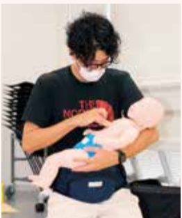
人形を使って力の入れ方を確認します

8月5日(土)午前9時～正午。消防署本署。市内在住・在勤・在学の中学生以上の方15人(先着順)。筆記用具。動きやすい服装でお越しください。 ☎ 電話または直接、本館3階の消防救急課 ☎21-9729へ。