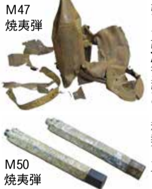
M47 焼夷弾 M50 焼夷弾

アメリカ軍の「作戦任務報告書」によれば、この空襲で投下された焼夷弾はM47焼夷弾とM50焼夷弾の2種類。M