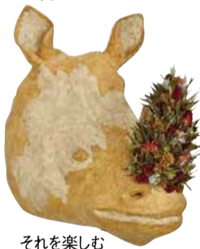
それを楽しむ (令和4年)

■サカナ部屋 水族館から海に帰されるジンベエザメ、きれいなゴミに囲まれるクジラなど、与えられた環境の中で生きる水の生き物などを展示します。