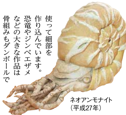
ネオアンモナイト (平成27年)

使って細部を作り込んでいます。恐竜やジンベエザメなどの大きな作品は骨組みもダンボールで作られています。