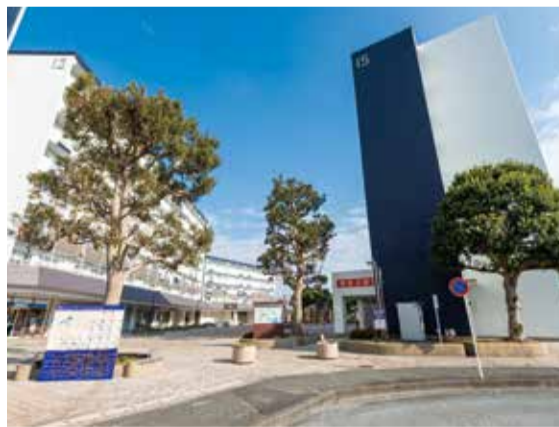
JR東海道線「平塚」駅 バス20分 徒歩1～3分

*1 最長5年間最大5%家賃減額。 *2 一定の条件がありますので、お問い合わせください。住戸内写真は一例です。