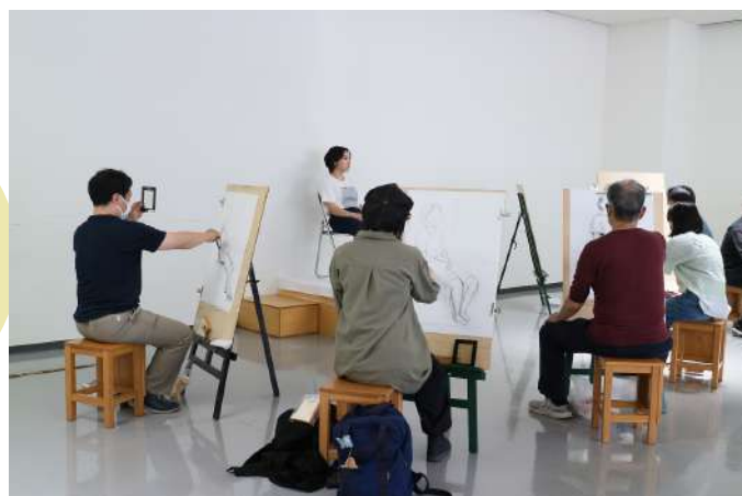
2023年6月開催 東海大学協働事業デッサン教室のようす

東海大学の先生方から 道具の使い方や描き方 対象の観察の仕方など 木炭デッサンの基礎を 学ぶことができます