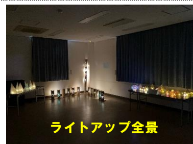
ライトアップ全景

来館された方々は、中学生たちの工作がほのかな光を放つ幻想的な光景に感動していました。