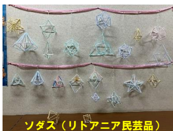
ソダス(リトアニア民芸品)