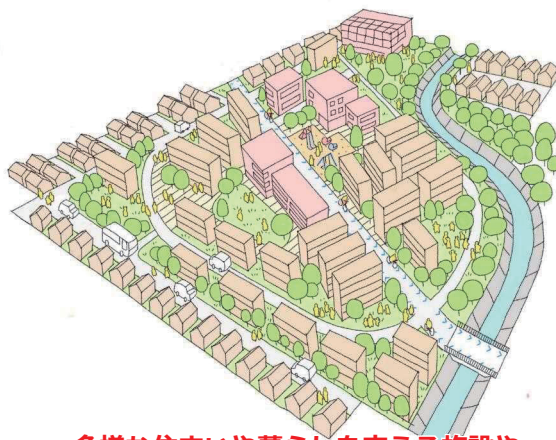
多様な住まいや暮らしを支える施設やサービスがあるまちのイメージ