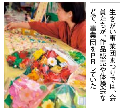
生きがい事業団まつりでは、会員たちが、作品販売や体験会などで、事業団をPRしていた