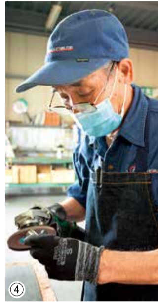
①特殊な円形の刃が付いた機械で金属素材を切断していく。高い技術力を信頼して、派遣後に任されるようになった新たな仕事②長さが正確か確認。36ミリのぴったり③④切断面の角を削り、きれいな部品が完成