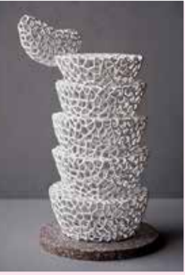
《五つの白い地平》令和元年

湘南を拠点に活躍する彫刻家です。軽やかで斬新な彫刻16作品をお楽しみください。 12月5日(火)~令和6年4月7日(日)。美術館。 アーティストトーク 12月17日(日)午後2時~2時30分。テーマホール。