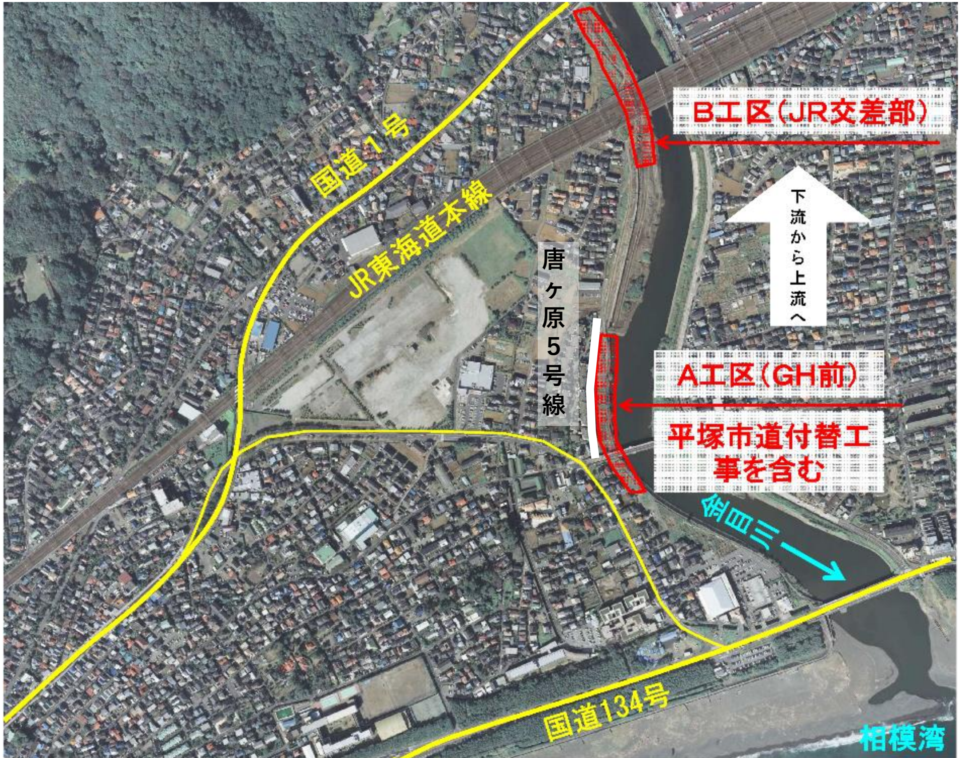
上流から下流を見た図