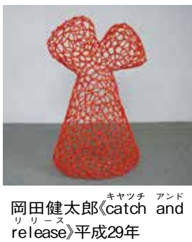
キャッチ アンド リリース 岡田健太郎(catch and release)平成29年

■岡田健太郎 重なる景体 軽やかで斬新な彫刻16作品を紹介。4月7日(日)まで。アーティストトーク 2月10日(土)午後2時〜2時40分。