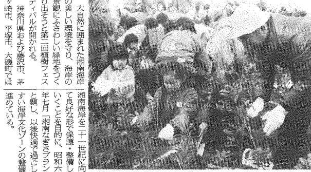
昭和62年に開かれた第1回の植樹フェスティバル

広報課では、春休み期間を利用して市内の施設を観光バス等で案内する親子施設見学会を開く。 今回は施設見学の外、湘南の海線や伊豆の山々を眺めながらのんびりした一日を過ごしていただくため、平塚八景の一つとなっている湘南ハイキングコースを歩いている。 春休みの思い出に、お父さんやお母さんと一緒に、またはお友達と誘い合ってご参加を。 ▼実施日 3月28日(水)、29日(木)の2回 ▼集合 市役所市民ホール(前8時40分) ▼コース 市役所(午前9時30分) ▼写真撮影は湘南平にあてて