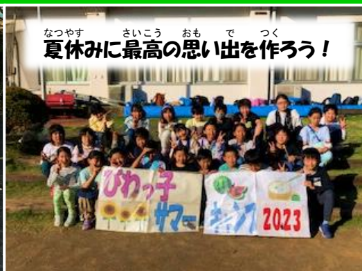
夏休みに最高の思い出を作ろう！