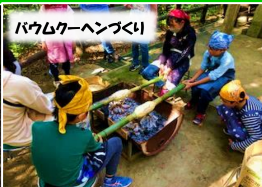
バウムクーヘンづくり