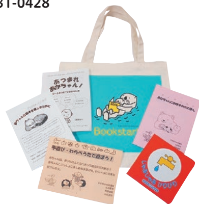
無料でプレゼント

市民ボランティアと図書館職員が、読み聞かせの方法などを話しながら、ブックスタートパック(絵本1冊とブックリストなどのセット)を無料でプレゼントしています。対象は市内在住の赤ちゃんと保護者。