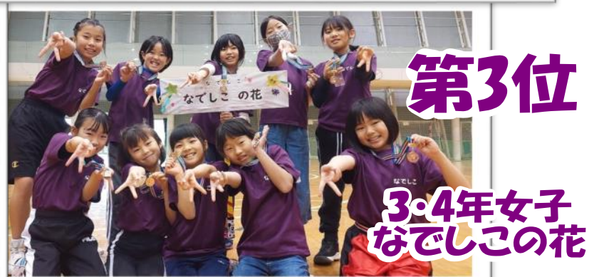
第3位 3・4年女子 なでしこの花

2月11日(日)に開催された第52回平子連スポーツ中央大会・ドッジボール大会に向けて練習に励んだ結果、5・6年男子、5・6年女子、3・4年男子の3チームが見事優勝!!その他のチームもカー杯頑張りました。ご参加いただいた選手、ご協力いただいた保護者、ボランティアの皆さま、お疲れさまでした!そしておめでとうございます!