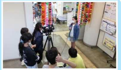
■7月：短冊に夢を書こう