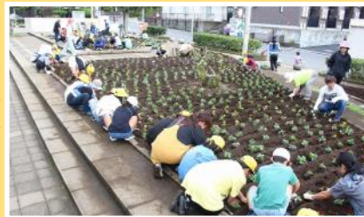
■10月：花いっぱい公園・公民館をつくろう！