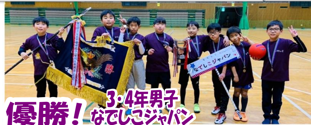
優勝! 3・4年男子 なでしこジャパン