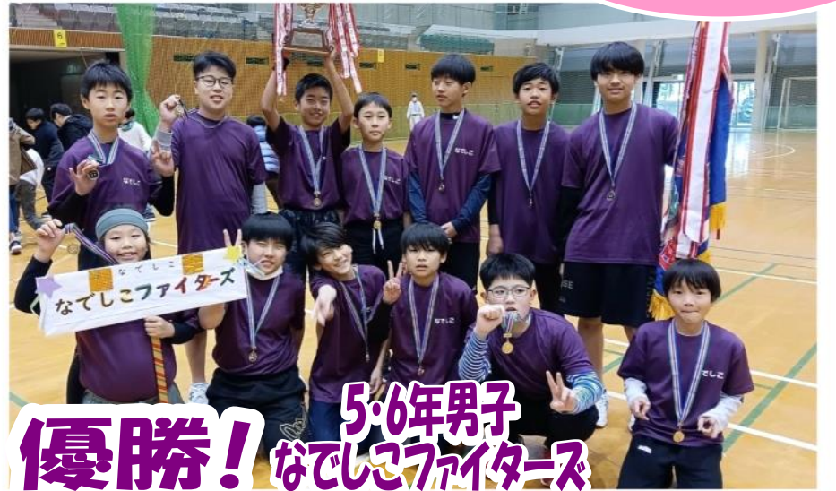
優勝! 5・6年男子 なでしこファイターズ