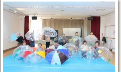
■12月：雨の日を、晴れにする。ピニ傘アート