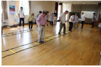
■6月：気軽に始める！ストレッチ&トレーニング