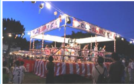
■7月：第24回なでしこ大BONおどり大会

完全復活の大BONおどり大会を開催！BONおどりリーダーの児童が盛り上げてくれました。感動♪短冊に夢を書こうではケーブルテレビからインタビューを受ける児童も。夏休み親子工作教室ではプロ顔負けの作品が仕上がりました！