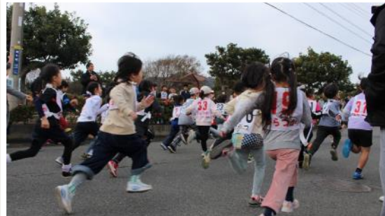
■1月：新春ちびっこマラソン

冬にはなでしこ防災教室実施！起震車がなでしこ公民館にきました。ピニ傘アートでは雨の日も晴れた気持ちになる傘が完成！1月には新春ちびっこマラソンを実施。元気よく駆け抜けました！