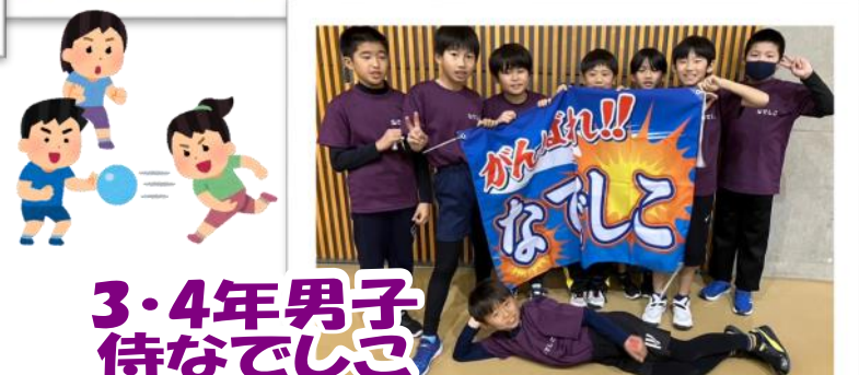
3・4年男子侍なでしこ

2月11日(日)に開催された第52回平子連スポーツ中央大会・ドッジボール大会に向けて練習に励んだ結果、5・6年男子、5・6年女子、3・4年男子の3チームが見事優勝!!その他のチームもカー杯頑張りました。ご参加いただいた選手、ご協力いただいた保護者、ボランティアの皆さま、お疲れさまでした!そしておめでとうございます!