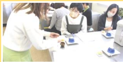
■10月：美味しく学ぶ薬膳茶