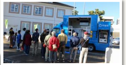
■12月：なでしこ防災教室