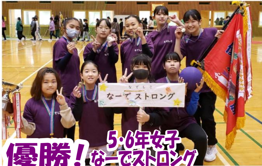
優勝! 5・6年女子 なでしこストロング