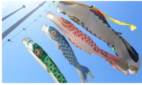
■5月：舞い上げ！こいのぼり

季節の風物詩「舞い上げ！こいのぼり」はここ数年の定番となりました。6月には人気企画となった坐禅体験を実施。健康を意識したストレッチ&トレーニングでは筋肉痛になるほど盛り上がりました！