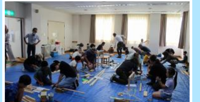
■8月：夏休み親子工作教室