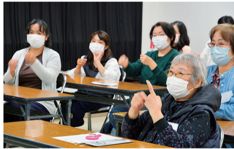
基礎からしっかり学びます

選考。一日の勤務時間は①2～7時間②3～6時間。時給1,417円。勤務場所は保健センター。採用は4月以降の予定です。 ①臨時管理栄養士 乳幼児の相談・健康教室などの母子保健業務や健康教育・健康相談などの成人保健業務をします。管理栄養士の資格があり、臨床経験がある方数人。 ②臨時歯科衛生士 幼児の健診・相談・教室などの母子保健業務をします。歯科衛生士の資格があり、臨床経験が3年以上ある方数人。 ☎ 履歴書に資格証の写しを添え、郵送または直接、3月19日(火)までに、〒254-0082東豊田448-3健康課 ☎55-2111へ。