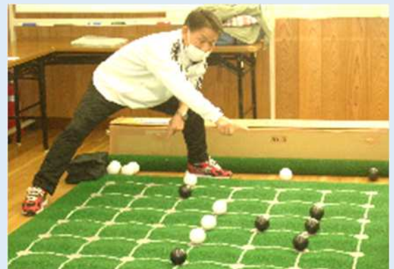
白か黒か勝負の行方はいかに！？

今年から囲碁ボールのセットを南原公民館に置くことになりました。地域の団体で「 囲碁ボールをやってみようかな？ 」という場合には、 南原公民館まで ご相談ください。道具の用意や指導者の依頼などの手続きを承ります。