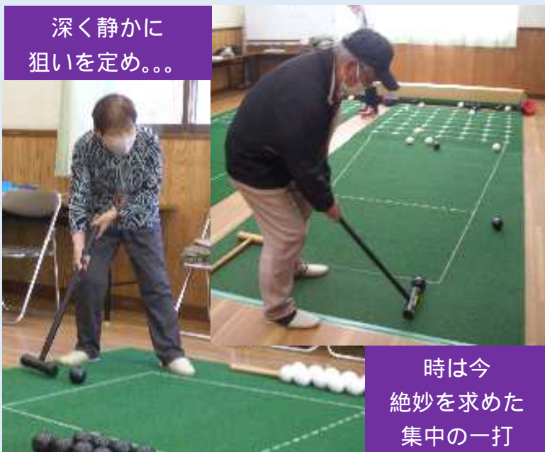
深く静かに 狙いを定め。。。

みんなでお互いの一打に歓声を上げながら行う囲碁ボールは、とてもにぎやかで楽しい時間となりました。「囲碁ボールの大会はあるのかしら？」という声も聞こえたので、いつの日か南原チームが結成できると素晴らしいですね。