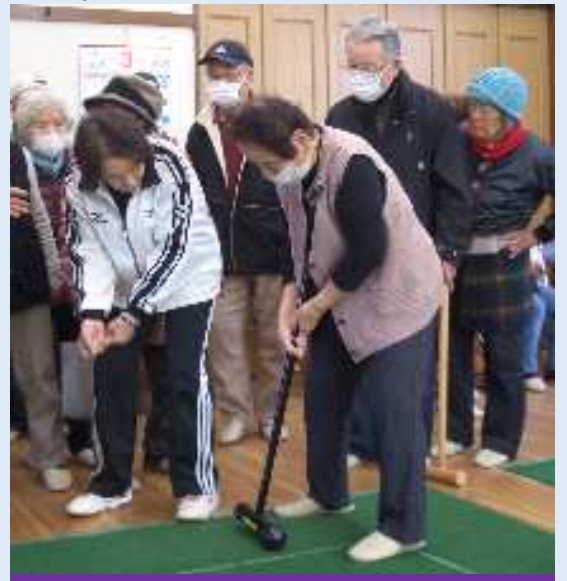
指導員も丁寧に教えてくれました

強く打ってはマットの外に飛び出したり、弱く打っては得点エリアに届かなかったり、絶妙の力加減を求めた一打にお互いに大注目の試合が繰り広げられました。