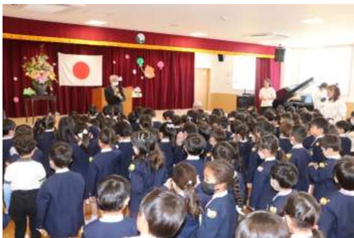
△新ホールでの始業式