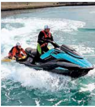
市民の安心・安全を守ります

採用は令和7年4月1日(火)。平成11年4月2日～平成16年4月1日生まれで、①～③のいずれかを満たす方4人(選考)。 ①大学を卒業(令和7年3月卒業見込みを含む)②大学卒業程度の学力がある③救急救命士の資格がある(令和7年3月資格取得見込みを含む)。 詳しくは、市ウェブなどにある募