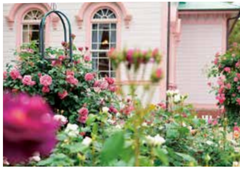
八幡山公園のバラ

健康づくりに取り組む健康推進員になりませんか。 7月5日(金)～10月23日(水)、全8回、午後1時30分～3時30分。保健センター(東豊田48-3)。市内在住の方20人(先着順)。 ☎ 電話または直接、健康課 ☎55-2111へ。