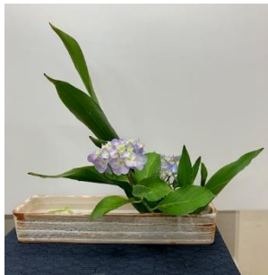
生け花：宏道流師範