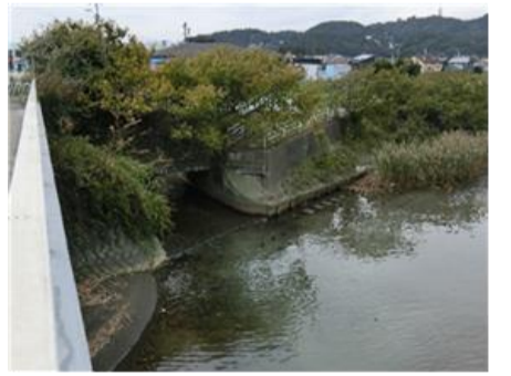
花水川に注ぐ三澤川 (花水川橋下)