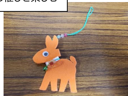
近くの神社で初詣