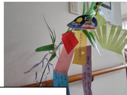
参加者と季節の催しを楽しむ