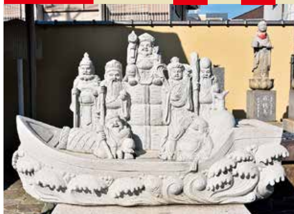
蓮光寺には、宝船に乗った七福神の石像がある

「平塚駅を中心に、七福神を祭る寺社が建っています。コンパクトな範囲に収まっているので、巡りやすいと思います」と続けます。上り・下り坂が少なく、ほとんどが平