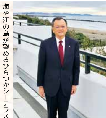
海や江の島が望めるひらつかシーテラス

あけましておめでとうございます。 昨年、平塚市は、戦後80年、核兵器廃絶平和都市を 宣言してから40年の節目を迎えました。昭和40年に建 立した八幡山公園にある平和慰霊塔の再整備を始め、 高校生が描いた原爆の絵の展示などさまざまな事業を 実施しました。改めて平和の尊さ、命の大切さを再認 識することができました。