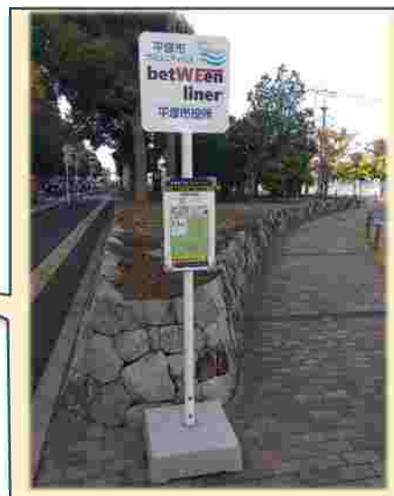
新設された平塚市役所バス停と「betWEen liner」