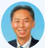
諸伏 清児 議員