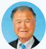
黒部 栄三 議員