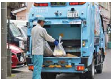
平塚市で拡大が進む戸別収集

により、ごみ袋を有料化する考えがあるのか伺う。 環境部長 現在、戸別収集を進めており、令和9年度中に市内全域に拡大する考えである。戸別収集の移行による、ごみ袋有料化の考えは持っていない。 ▼このほかの質問 休館となる中央公民館の代替施設 市役所内の業務改善ツール