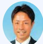
久保田 聡 議員