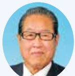
府川 正明 議員