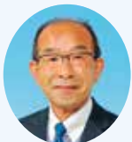
須藤 量久 議員