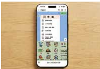
座間市民の8割が登録している公式LINE