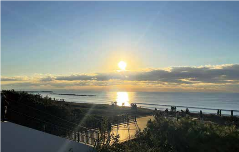
「ひらつかシーテラスからの初日の出」 (撮影日 令和8年1月1日)

今定例会では、定例会初日に人事院勧告を踏まえて、一般職員及び特定任期付職員の給料表を改定するとともに、一般職員及び特定任期付職員の期末手当及び勤勉手当の支給率並びに特別職員及び議会議員の期末手当の支給率の見直しを行うほか、通勤手当の見直しに伴い、規定を整備する議案が上程されました。採決の結果、賛成多数で可決されました。