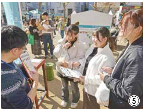
① 社会実験でアンケート用紙に記入 ② 湘南スターモール商店街に設置したベンチでくつろぐ ③ 大門市に合わせて新宿公園で開いた社会実験 ④ ⑤ 「こんなまちになったらいいな」と意見交換