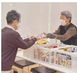
食品を寄付しませんか

リーナ(中堂246-1)。高校生以上の方24人(先着順)。室内履き・持ち帰り用の袋。200円。