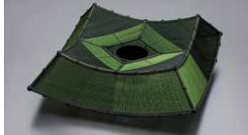
◀彩変化花器「○△□」