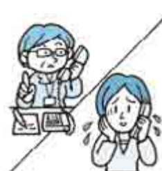
困ったときはすぐ相談