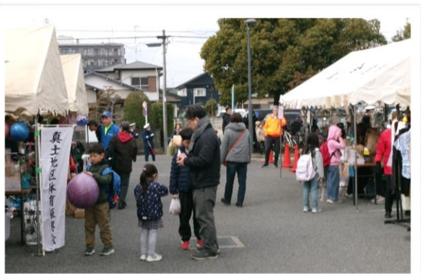
【模擬店部門賑わいの様子】