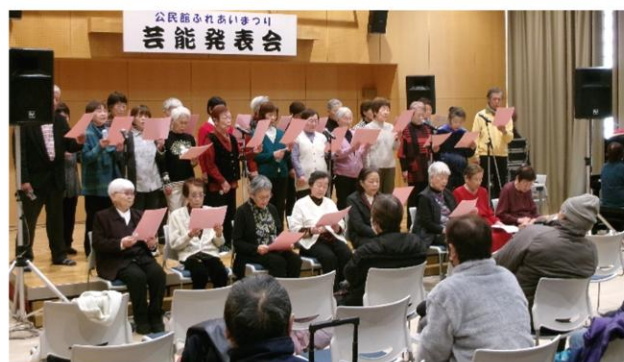
【芸能部門(歌唱)の様子】