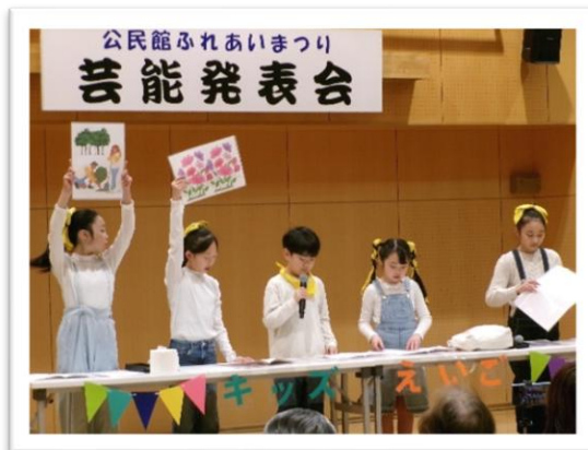
【芸能部門(英語スピーチ)の様子】