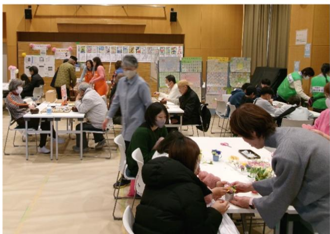
【体験コーナー賑わいの様子】

バラエティーに富んだ模擬店や体験部門会場は人でいっぱい賑わい、展示部門や芸能部門では、練習の成果を存分に発揮した発表でまつりを盛り上げてくださいました。ご来場、ご参加、ご協力いただきありがとうございました。来年の開催もお楽しみに♪