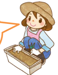
菜園ポットイメージ (昨年の様子)