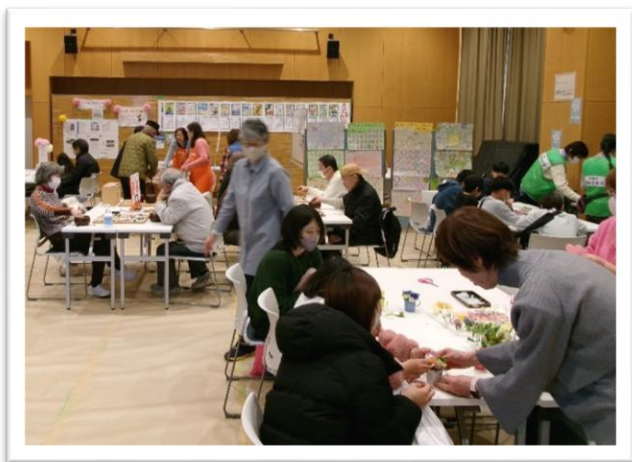
【体験コーナー賑わいの様子】

バラエティーに富んだ模擬店や体験部門会場は人でいっぱい賑わい、展示部門や芸能部門では、練習の成果を存分に発揮した発表でまつりを盛り上げてくださいました。ご来場、ご参加、ご協力いただきありがとうございました。来年の開催もお楽しみに♪