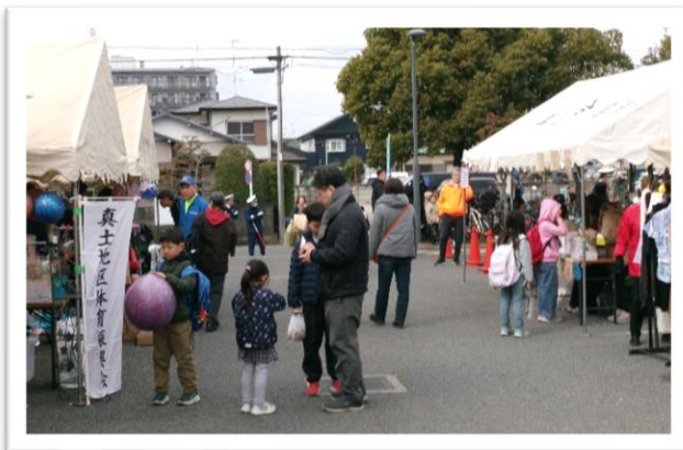
【模擬店部門賑わいの様子】