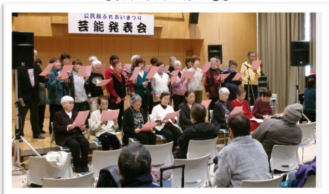
【芸能部門（歌唱）の様子】