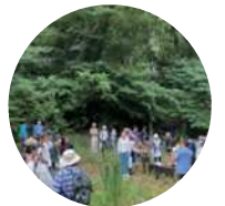
第40回ワークショップ「トンボの里」の視察

環境保全を始め、様々な社会課題の解決に取り組み、ネイチャーポジティブ(生物多様性の損失を止めて回復させること)達成へ向けて貢献してまいります。