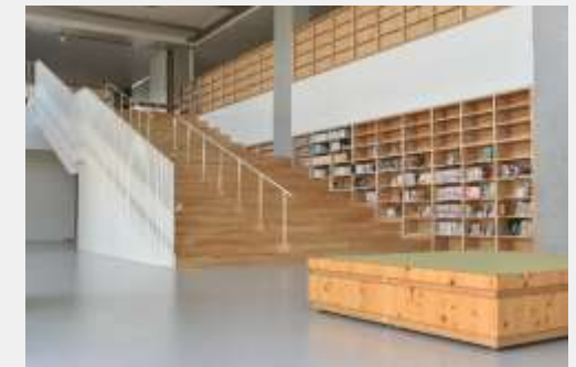
上段：土屋小学校（1980年3月完成）