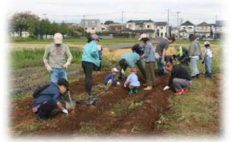
【昨年度の収穫体験の様子】