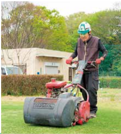
専用の機械で芝を刈ります

施設などに企業名や商品名を付けられる「ネーミングライツ制度」が同施設に導入されてから10年が経ちました。平成28年から、地元の土沢地区に本社を置く木村植物園がネーミングライツパートナーとなっています。1番ホール付近には、施設の看板(下写真)が設置されています。