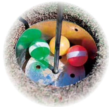
「狙い」と目を輝かせます。狙い通りボールを打てたり、カップイン(左写真)したりし