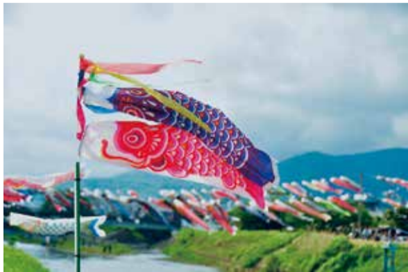
鈴川鯉のぼりまつり