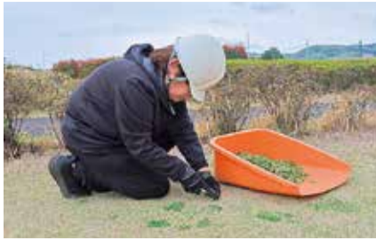
丁寧に雑草を除去します

気持ち良くプレーができるコース環境は、日々の小まめな芝管理の積み重ねによって築かれています。これからも快適なコース作りは続きます。