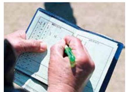
管理棟にあるスコアカードと鉛筆を持ち歩き、打数を記録できます