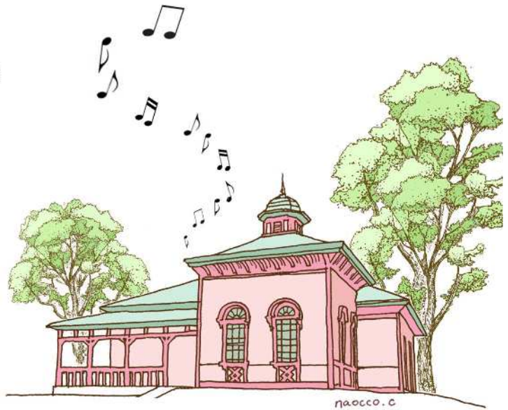
国登録有形文化財 (建造物)