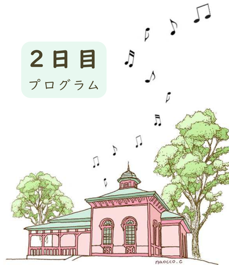
国登録有形文化財(建造物)