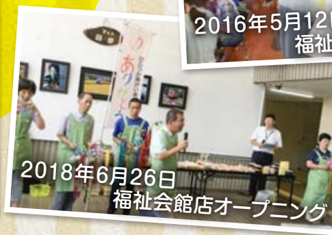
2018年6月26日 福祉会館店オープニング