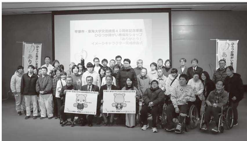
ひらつか障がい者福祉ショップ「ありがとう」イメージキャラクター完成披露式 令和8年2月13日(金) 平塚市美術館1階 ミュージアムホールにて

この事業は、東海大学教養学部芸術学科の池村教授と熊谷助教、学生11名様にご協力をいただきました。学生皆様が「ありがとう」をイメージしてデザインした個性豊かなキャラクター11作品の中から、福祉事業所34か所及び平塚市障がい福祉課の関係者計1,039名による投票で「ありまる」が選ばれました。