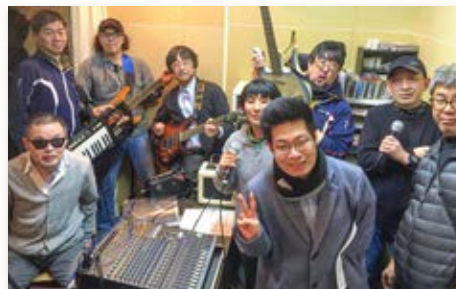
制作: ナバサクラブ 協賛: チームありがとう

ひらつか障がい者福祉ショップ「ありがとう」を拠点に発信する福祉情報番組です!! 情報コーナー(自主製品紹介・イベント案内)、ゲストによるトークコーナー、「とびっきりレインボーズ」のゴーゴーバンド天国(自主音源による音楽紹介コーナー)など盛り沢山の企画です。心のバリアフリーを体感できる元気が出るラジオです!!