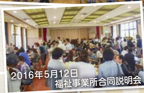
2016年5月12日 福祉事業所合同説明会