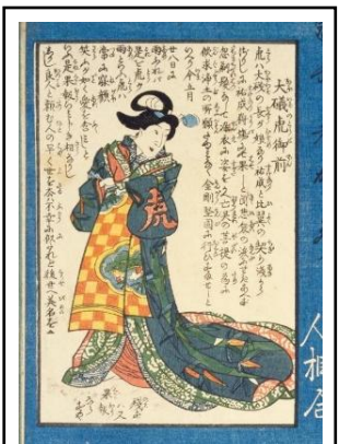
大磯虎御前『武者かゝ美一人相合』より

（注1）『吾妻鏡』第13巻 （注2）『甲陽随筆』加賀美遠清、天明期。『甲斐志料集成』所載。 （注3）『甲斐国志』114巻 土庶部13『甲斐志料集成』所載。 （注4）『神奈川新聞社WEBマイクロフィルム』『大磯町史新聞記事目録 第3集』 （補注1）相殿（あいどの）は、同じ社殿に二柱以上の神を合わせて祀ること。又はその社殿。 （補注2）『芦安村誌』（平成6年） （追補）『北里見聞録』（近世芸叢書10）の「大磯虎の事」（虎御前の事）に、「相州大磯の遊女、同国諸越里の産、幼名を於兔（おと）と唱え、後に虎と改名す、於兔は唐土の方言にて虎の事也」とある。