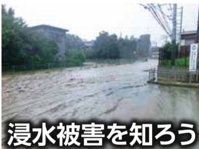
浸水被害を知ろう

市内であった水害の中で記憶に新しいのが、令和6年の台風第10号での被害です。この台風による降水量は、気象庁の地域気象観測システム（アメダス）で、平塚市での観測史上最大値を記録しました。最大値となったのは、1日で降った雨量（8月30日）