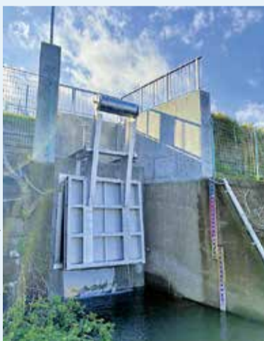
ゲート改修工事をした田村の駒返排水水門

全国的に浸水被害が発生する中で、平塚市では総合浸水対策基本計画に基づいた取り組みを進めています。計画では過去の大雨による被害状況などから重点対策地区を選定しました。住宅地などに降った雨水を速やかに排水するための下水道管の整備や、河川への流出抑制のため、上流域にある調整池に特殊バルブを設置するなどの対策を進めてきました。また家庭や事業所などでできる浸水対策として、土のうステーションの設置や、住宅に雨水貯留槽・簡易止水板を設置する際の補助制度を設けています。