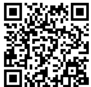
ちいき情報局 安心・安全の街 富士見 ＜スマートフォン版＞

【方法1】 右図の二次元バーコードをスマートフォンで読み込み、表示されるURLを押す。