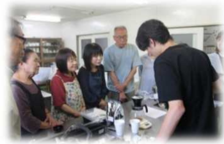
【昨年度のコーヒーの淹れ方講座の様子】