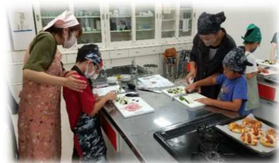
【昨年度のパンづくり教室の様子】