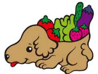
平塚産農産物PRキャラクター「ベジ太」