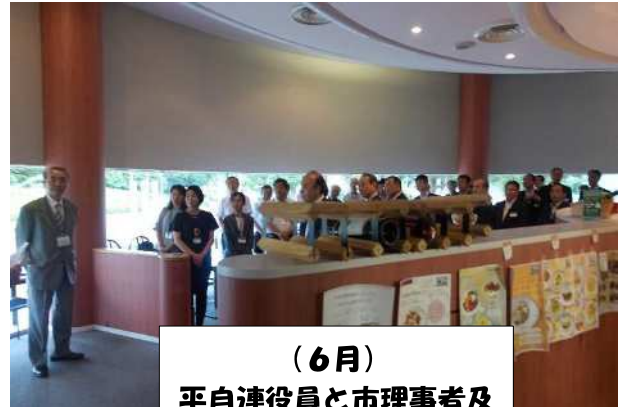
(6月) 平自連役員と市理事者及 び部長との意見交換会