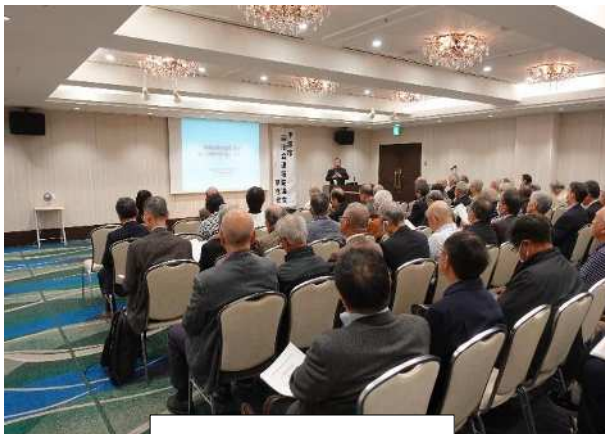
(11月) 自治会長研修会