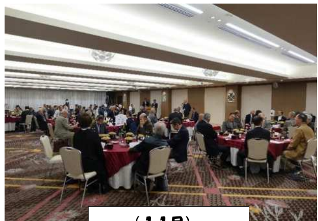
(11月) 自治会長意見交換会