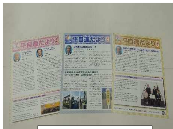
(7月・11月・3月) 「平自連だより」の発行