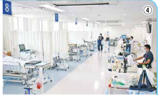
④複数のベッドが並び救急病棟。ベッドの向かいにスタッフステーションがあり、患者の容体を確認できる