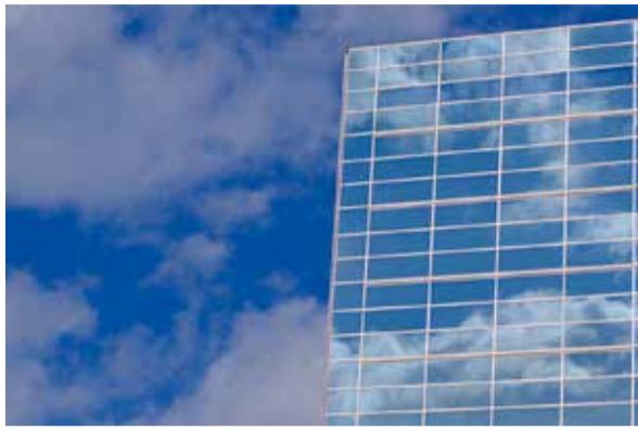
駅前ビルに映る青空