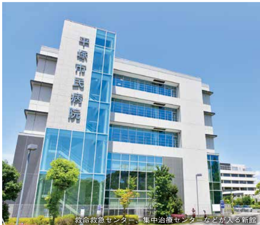
救命救急センター、集中治療センターなどが入る新館