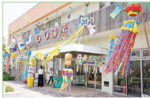
昨年度の地区別の部1等 大野公民館

7月3日(金)～5日(日)に開かれる湘南ひらつか七夕まつりで、七夕飾りのデザインやアイデアを競うコンクールをします。「中心街の部」「地区別の部」に応募しませんか。市内の個人商店や企業、団体の他、子ども会など地域の方が参加できます。