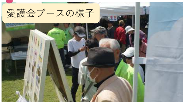
愛護会ブースの様子

4月25日（土）、26日（日）に平塚市総合公園で、第50回緑化まつりが開催されました。天候にも恵まれ公園愛護会ブースにも多くの方々に立ち寄りいただき、200名を超える方がアンケートにも回答してくださいました。アンケート結果は裏面をご覧ください。