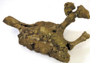
二宮層からの鯨類脊椎化石