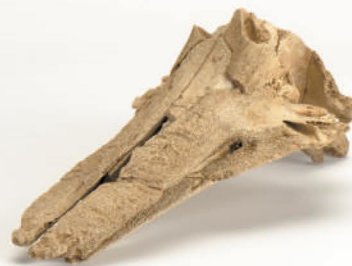
五領ヶ台貝塚出土鯨類頭骨

【関連行事】 行事の詳細や申込制の行事についてはHP ( https://www.hirahaku.jp/ ) をご覧ください。参加費は無料です。対象が指定されていないイベントはどなたでもお申込み、ご参加いただけます。