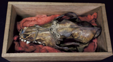
オカシラ(ニホンオオカミ頭骨)